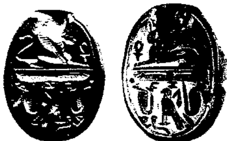
חומת פינקי יזבל

נדיר במקרא 31 , אבל נמצא כתוב על בני חוקת שנמצאה בלביש. וענינו של השם: 'אח' (- נרצ, מלשון 'זה רודי ונהרצי') הוא 'האב' המשמש כנראה, ככינוי לה: 'הוא הוא אביך קנף וגו' (וב לכוונתו). ולפרוש זה ענין השם 'אחאב' כענין השם 'אחיה'. וימלך אחאב בן-עמרי - הנפל לחיוב, ומצאנו, שבמעשי אחאב הכתובים מרבים לדבר יותר מאשר במעשי כל מלך אחר אשר מלך בישראל.